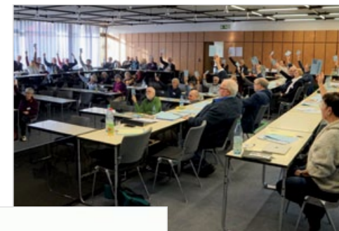
pax christi Delegiertenversammlung 2022 in Fulda – den Abstimmungen gingen intensive Diskussionen voraus

Auch im achten Monat des völkerrechtswidrigen Angriffskrieges des Putin-Regimes gegen die Ukraine erfahren diejenigen, die sich für einen sofortigen Waffenstillstand und internationale Verhandlungen einsetzen viel Widerspruch. Aber es gibt auch ermutigende Signale.