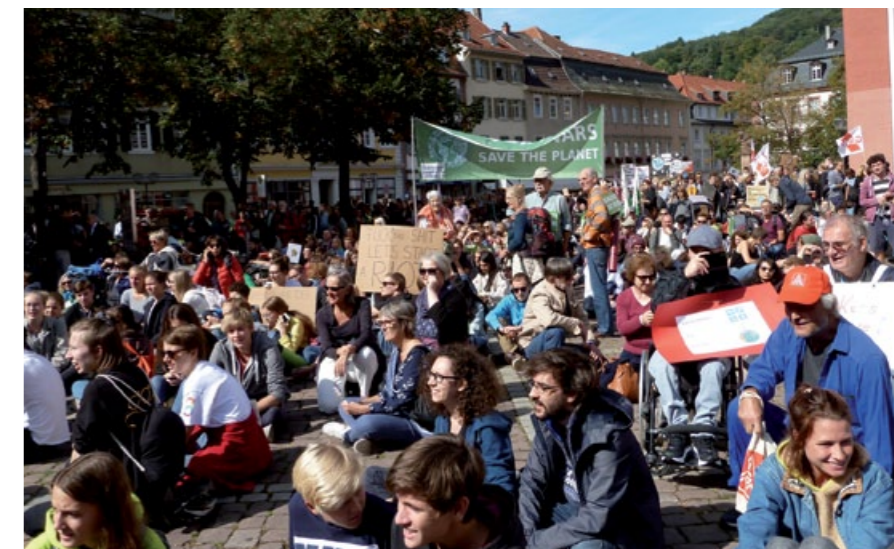
Sit-in beim weltweiten Klimastreiktag 2019 auf dem Uniplatz in Heidelberg