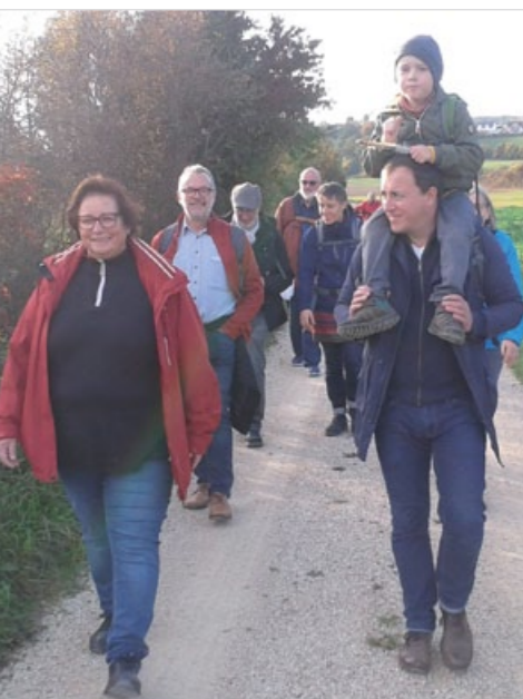
Kleine und Große auf den Spuren des Hl. Martin unterwegs im Donautal von Obermarchtal bis Untermarchtal beim pax christi Pilgertag