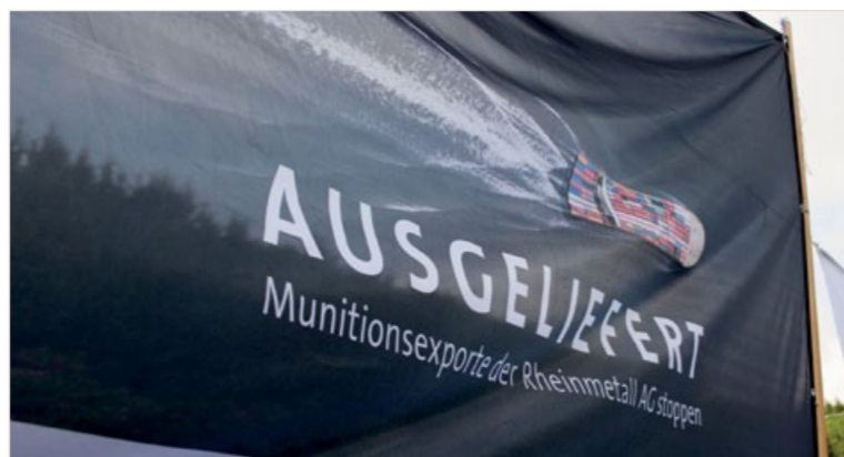
„Ausgeliefert“ – Protest gegen Rüstungsexporte der Rheinmetall AG

Ich empfinde es als sehr großen Erfolg, dass ich es zusammen mit der „Aktion Aufschrei – Stoppt den Waffenhandel!“, Greenpeace und pax christi unter hohem Zeitaufwand erreichen konnte, dass Saskia Esken in die Hauptverhandlungsrunde der Koalitionsverhandlungen Mitte November 2021 ein nationales Rüstungsexportkontrollgesetz (REKG) mitnimmt und ab Zeile 6533 des Koalitionsvertrags zu einer wirklich restriktiveren Rüstungsexportpolitik verankern konnte. Der neue Staatssekretär im Bundesministerium für Wirtschaft und Klima, Sven Giegold hat dann auch im Februar 2022 den