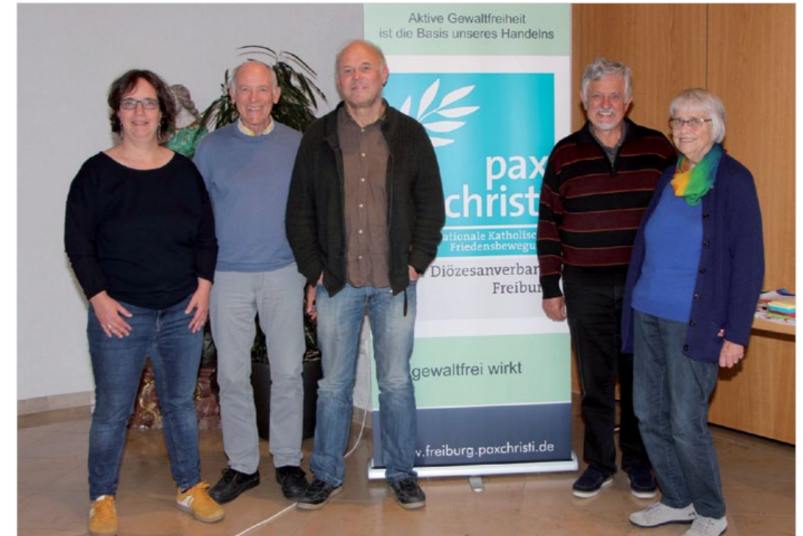
Das für drei Jahre neu bestätigte Vorstandsteam

Systeme in die Lage versetzen, Konfliktdynamiken zu erkennen, Konfliktpotentiale mit friedlichen Mitteln zu bearbeiten und Konflikteskalationen zu vermeiden. Dabei ist die Orientierung an einem prozessorientierten, positiven Friedensbegriff und einer Kultur des Friedens als Leitbild friedenspädagogischen Handelns oftmals handlungsleitend.“