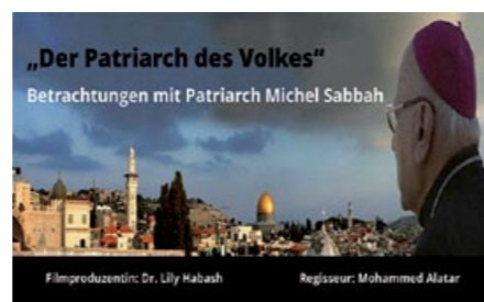
Im September 2021 wurde „Der Patriarch des Volkes“, ein Film über den Palästinenser Michel Sabbah, der 1987 zum lateinischen Patriarchen von Jerusalem ernannt wurde u. bis 2008 „Bischof von Jerusalem“ war, erstmals mit deutschen Untertiteln veröffentlicht. Dies wurde im Rahmen einer Initiative von pax christi Rottenburg-Stuttgart möglich.

Aussagen jedes Wort vorsichtig abwogen. So fand ich mich am Abend nach einer Filmvorführung in einer Podiumsdiskussion mit zwei Geistlichen wieder, die über Palästina sprachen. Ich fand sie großartig und bin mir sicher, dass sie dazu beitragen, Gottes Werk zu tun. Gleichzeitig hatte ich den Eindruck, dass auch sie mit größter Zurückhaltung ihre Worte wählen und genau überlegten, was sie sagen und was nicht.