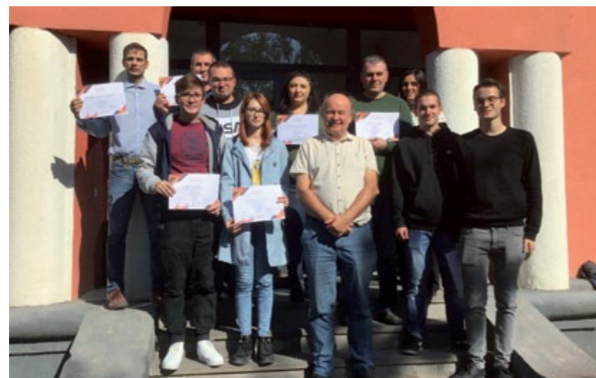
Teilnehmer:innen eines Seminars von act for transformation in Georgien zur Fortbildung von Personen, die beratend für Militärdienstentzieher und Deserteure tätig werden

Der Großteil der Georgier ist gegen die Einwanderungswelle aus Russland. Daraus wird auch kein Geheimnis gemacht. Im gesamten Land sieht man russlandkritische Graffitis und auch aus ihrer eigenen Meinung zur Situation machen die Georgier kein Geheimnis. Man muss bedenken, dass die georgischen Regionen