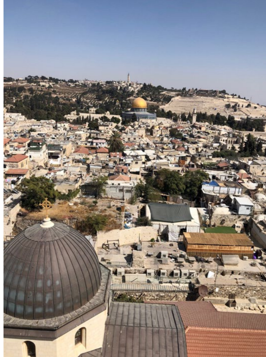
Für diesen Blick auf die Altstadt von Jerusalem mit Tempelberg und Felsendom in der Bildmitte erklimm Till den Turm der Erlöserkirche