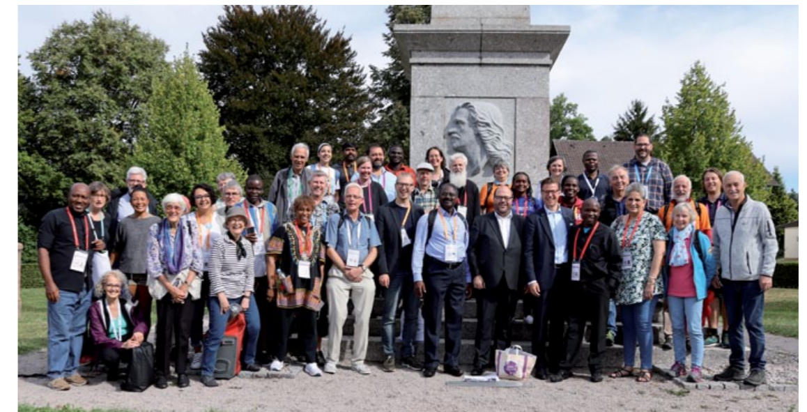
Internationale Gäste am Turenne-Denkmal in Achern