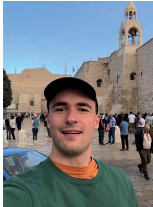
Ein Selfie auf dem Krippenplatz in Bethlehem mit Geburtskirche.