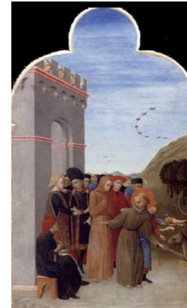
Szene aus der Legende „Der Wolf von Gubbio“: Der Hl. Franziskus und der Wolf