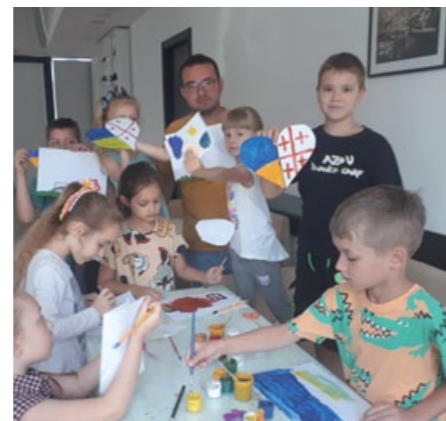
Arbeit mit geflüchteten Kindern im Büro von act for transformation in Tbilisi, Georgien